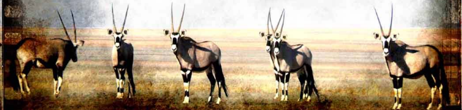
After the rain

DERDE IN PSSA SE LANDSWYE NUUSBRIEEFKOMPETISIE 2010