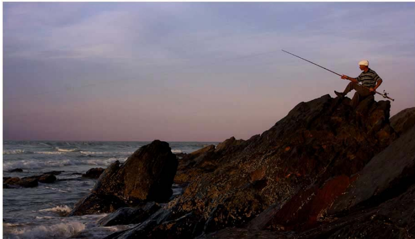
Suzette Coetzee - Visserman - Wenner 1-3*