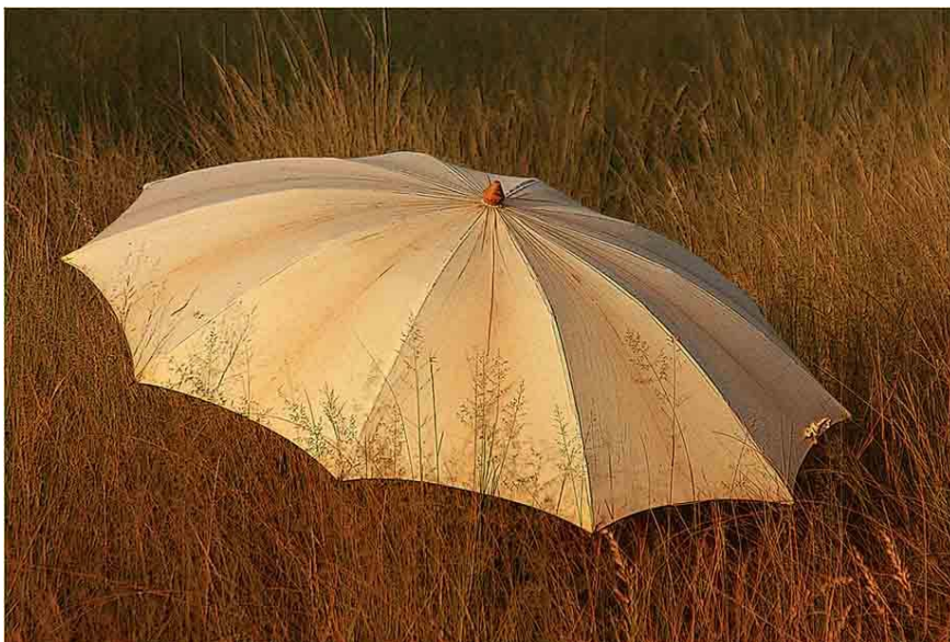
Anida Kotze - Flair - Wenner 4-5*