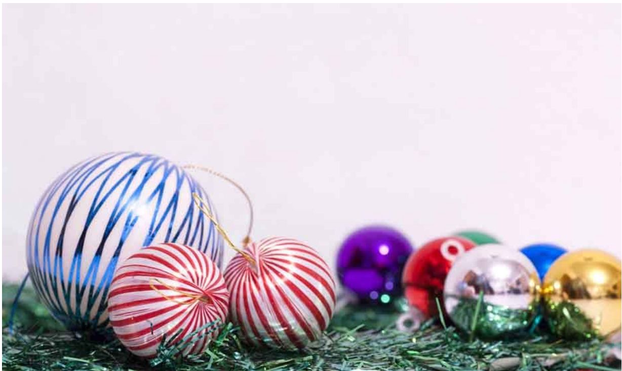
Jacques Deacon - Christmas stillife

As you explore your photography on whatever level, and as your skills develop, enjoy it for what it is. Enjoy a sense of accomplishment in how you improve or improve your images, and your skills. Resist the urge to be overly critical and poison the water that keeps your interest in images and photography growing. A good photo is always the one you are about to take, and it can be better for what you learned from the experience you gain as you shoot.